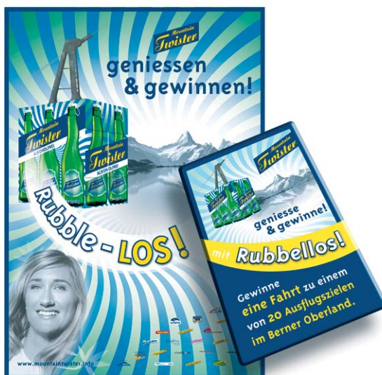
Das Werbesujet mit einem Rubbellos.