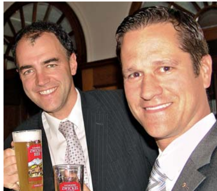
Christophe Darbellay, Präsident CVP Schweiz, und Marcel Kreber, Direktor des Schweizer Brauerei-Verbandes: Bei einem kühlen Bier lässt es sich besser politische Diskussionen führen.