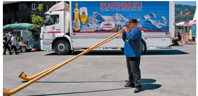
Rugenbräu und Alphornbläser: Passen gut zusammen.