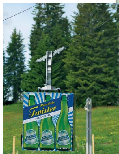
Ein Sixpack Mountain Twister fährt als Gondel bergwärts. Dies eine Sequenz aus dem Werbespot.