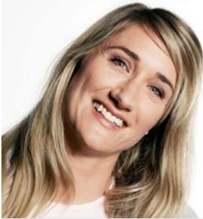
Tanja Frieden Boardercross-Olympiasiegerin www.tanjafrieden.ch

«DU WIRST EINMAL OLYMPIAGOLD HOLEN ...!»