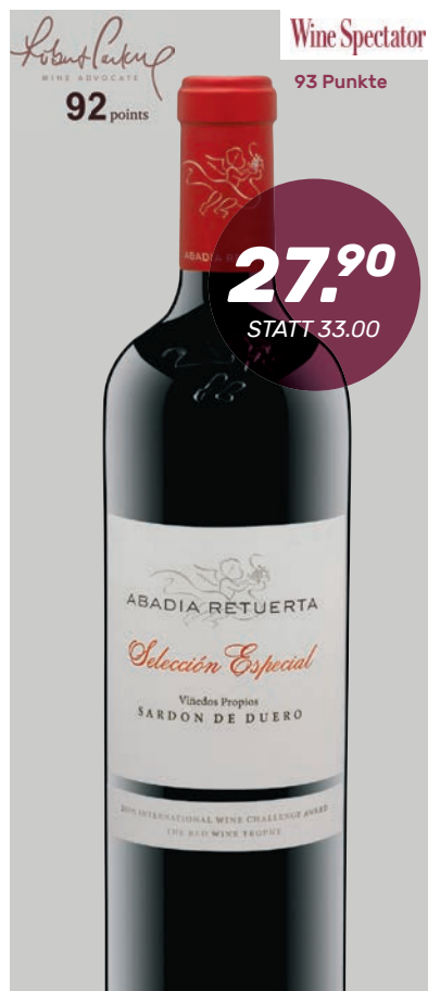
SELECCIÓN ESPECIAL Abadia Retuerta 75 cl

Im Bouquet diverse Fruchtaromen wie Kirschen und Beeren. Im Gaumen dann ein beeindruckendes Wechselspiel zwischen schwarzen und roten Früchten, Ausbauaromen durch die Fassreifung komplex mit Röstaromen und Noten von Zedernholz. Kraftvoll, elegant und mit einem schier endlos andauernden Finale.