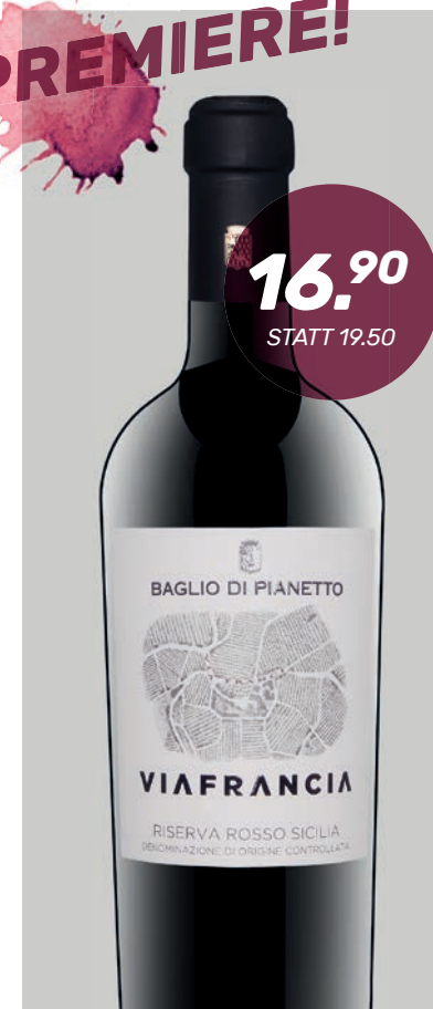
VIAFRANCIA RISERVA ROSSO DOC Baglio di Pianetto 75 cl

Im Glas brilliert ein klares, intensives Rubinrot. Heraus strömen florale Noten (Rose, Veilchen, Lavendel), aber auch fruchtige Aromen wie Kirsche. Ein würzig, gerösteter Abgang von Zedernholz, Leder, Nüssen, Pfeffer und Kakao, runden das intensive Geschmackserlebnis ab. Ein eleganter Wein, der nicht zu schwer ist und über ein intensives Bouquet verfügt.