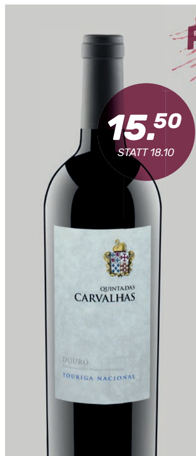
TOURIGA NACIONAL Quinta das Carvalhas 75 cl

Die Aromatik ist vielschichtig, intensiv: schwarze Kirschen, Waldbeeren, reifere Fruchtaromen sowie Tabak, Rauch und eine Spur von animalischen, ergänzt von zarten alkoholischen Noten, die an Rumtopf erinnern. Dieser erste Eindruck widerspiegelt sich im Gaumen, wo der mächtige, aber reife Gerbstoff auf eine frisch-fruchtige Struktur trifft.